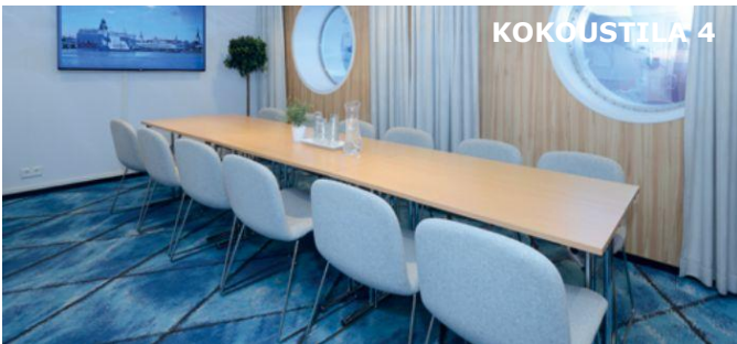
Kokoustila 12 hengelle. Yhdistettävissä tilan 5 kanssa 32 hengelle.