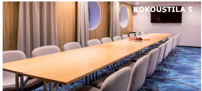
Kokoustila 20 hengelle. Yhdistettävissä tilan 4 kanssa 32 hengelle.