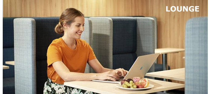
Lounge on rauhallinen paikka työntekoon matkan aikana.