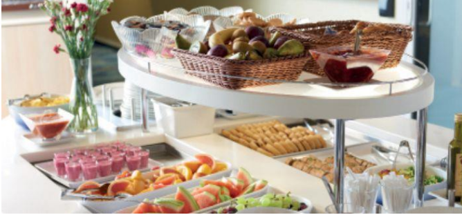
Kokouskeskus & Lounge tarjoilut.

Oli kyseessä sitten kokous, seminaari tai suunnittelupäivä, m/s Finlandian Kokouskeskus & Lounge on oivallinen paikka eri tilaisuuksiin. Kokouskeskus & Lounge paikkaan sisältyy aina tarjoilut sekä toimiva Wifi.